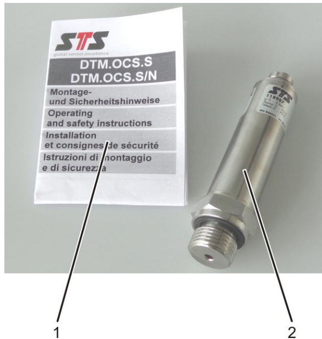
Abb. 1: Produktübersicht des Digital Transmitters DTM.OCS.S